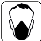
UTILIZAREA MĂȘTII DE PROTECȚIE