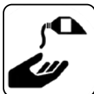
DEZINFECTARE PE MĂINI