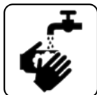
SPĂLARE FRECVENTĂ PE MĂINI CU APĂ ȘI SĂPUN