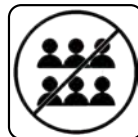
EVITAREA SPAȚIILOR AGLOMERATE